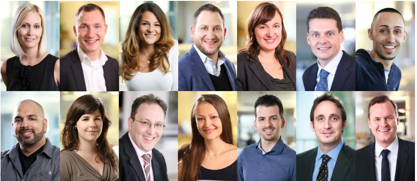
OLMeRO-Mitarbeiter des Bereichs "PBGU - Planer, Bauherren, GUs"