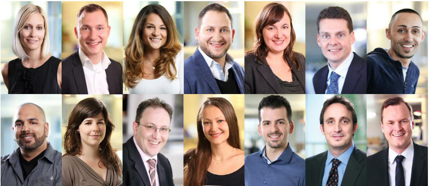
OLMeRO-Mitarbeiter des Bereichs "PBGU - Planer, Bauherren, GUs"